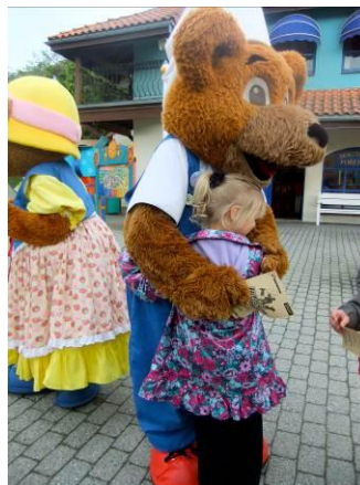
Ååå, for en god klem...

Så boltret og koste vi oss i Kongeparkens 50 elleville attraksjoner og opplevelser, før vi hadde en middagspause i sammen. Der ble vi møtt av en av Kongeparkens ansatte, som "geleidet" oss opp til ett flott koldtbord. Der var det muligheter til å sitte både inne og ute. Koldtbordet bestod av forskjellige grønnsaker, salater, poteter og dessert. Det stod flere kokker og grillet for oss også- vi kunne be om koteletter, pølser eller hamburger. Et fantastisk herlig måltid med gode samtaler og kos. For barna kom det en ansiktsmaler, og Brumle var da selvfølgelig med. Barna fikk også forsyne seg av popcorn og brus mens dette pågikk.