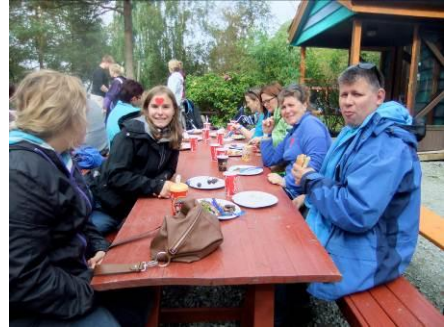
Samtale rundt bordet