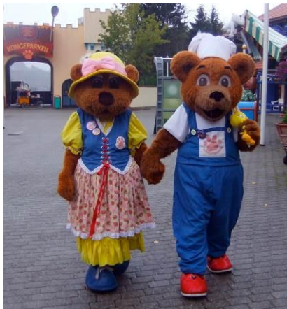
Brumle og Brummeline

Når vi kom inn ble vi møtt av Brumle og venninnen hans. Der fikk de som ønsket en god klem av dem begge.