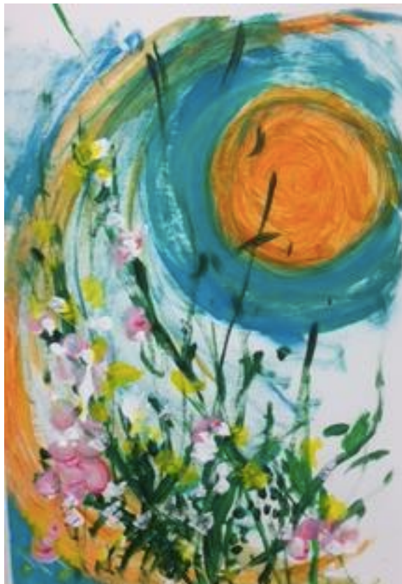
Takk til Randi for at vi får bruke maleriet ☺