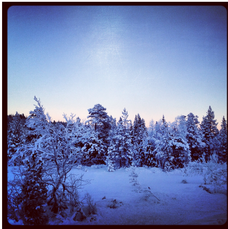
Osenfjellet vinteren 2013/14

(Klikk på "God Jul og Godt Nytt År" for en ekstra julehilsen ...)